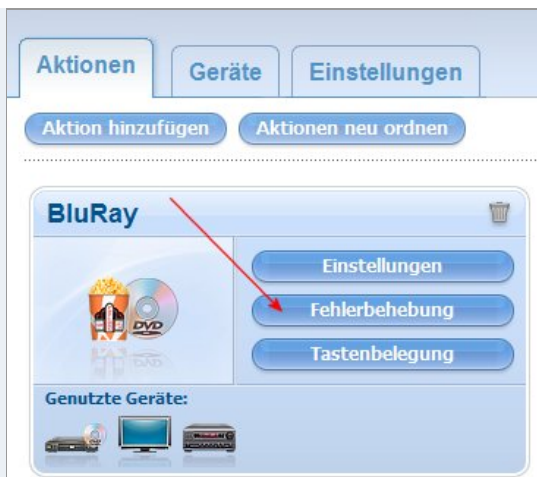
03-Aktion-Fehlerbehebung.jpg (23.32 KiB) 4329-mal betrachtet

... und beantworten die nächste Frage mit "Nein, ich möchte die Einstellungen ändern".